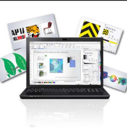
CorelDRAW Graphics Suite X7: Introductory Webinar