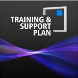
Training & Support Plan: Graphics & Painting