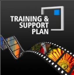
Training & Support Plan: Photo & Video