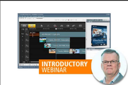
VideoStudio Pro X8: Introductory Webinar